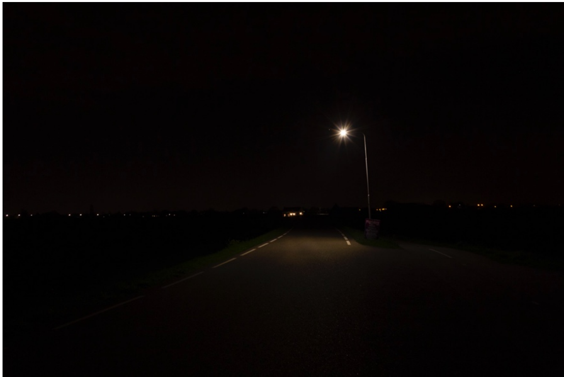
Foto: Kornedijk in Beusichem, een lichtpunt op de weg. Het licht is van verre zichtbaar. Maar ons oog trekt naar het licht toe en we zien niks ervoor en niks erna.

Soms kan het verblindend werken of zelfs de verkeersveiligheid in gevaar brengen.