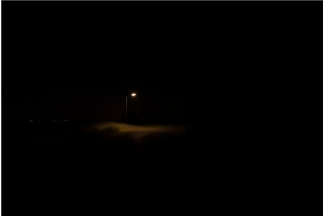
Foto: Aalswijksestraat in Buren, licht in bocht.

Voor de gemeente is het van belang dat het landschap ruimte biedt aan economische ontwikkelingen en aan de ontwikkeling van natuur en landschap, zodat het ook in de toekomst mooi en herkenbaar blijft.