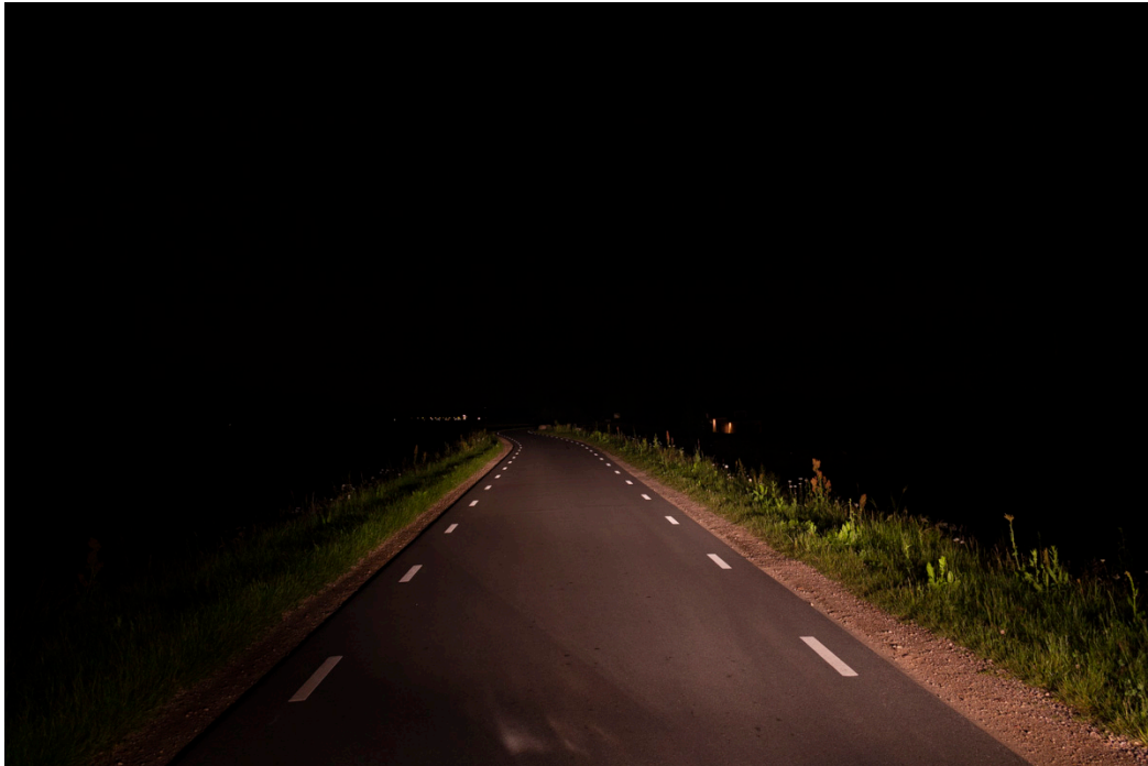
Foto: Rijnbanddijk in Ingen. Belijning die reflecteert waardoor het verloop van de weg goed te zien is.

Buiten de bebouwde kom verlichten we niet, tenzij het voor de verkeersveiligheid noodzakelijk is en er geen geschikte alternatieven zijn. Markering of reflectoren kunnen vaak een goede (of zelfs betere) bijdragen leveren aan de verkeersveiligheid.