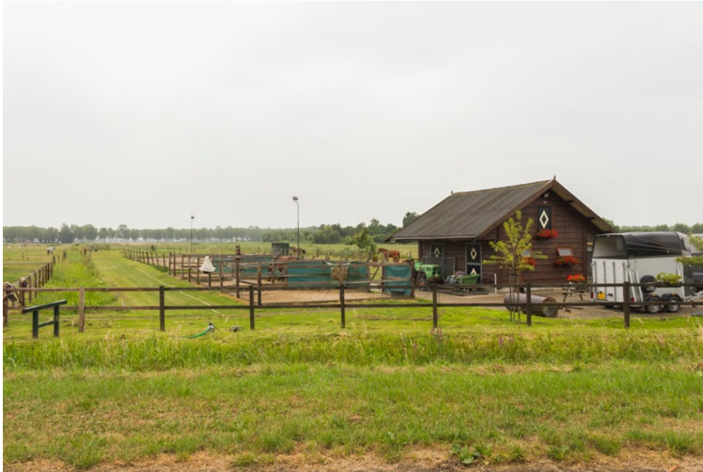
Foto: Zandbergseweg in Zoelen. Verlichting bij de paardenbak in een open gebied.

Vanwege het grote buitengebied dat we hebben, zien we steeds meer paardenbakken bij particulieren (hobbymatig). Ook staat daar steeds vaker verlichting bij. Dat zien we niet alleen overdag in het landschap, maar vooral in de avonduren. Hoewel het licht meestal maar een paar uur brandt, is het wel vaak veel en vooral ook fel. De paardenbakken liggen ook meestal in een open omgeving en zijn daardoor van ver al te zien.